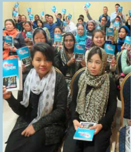
Qatar er et af de lande i verden, hvor kristendommen er i vældig vækst.

- Bestoh, Peace House's Internationale Kirke