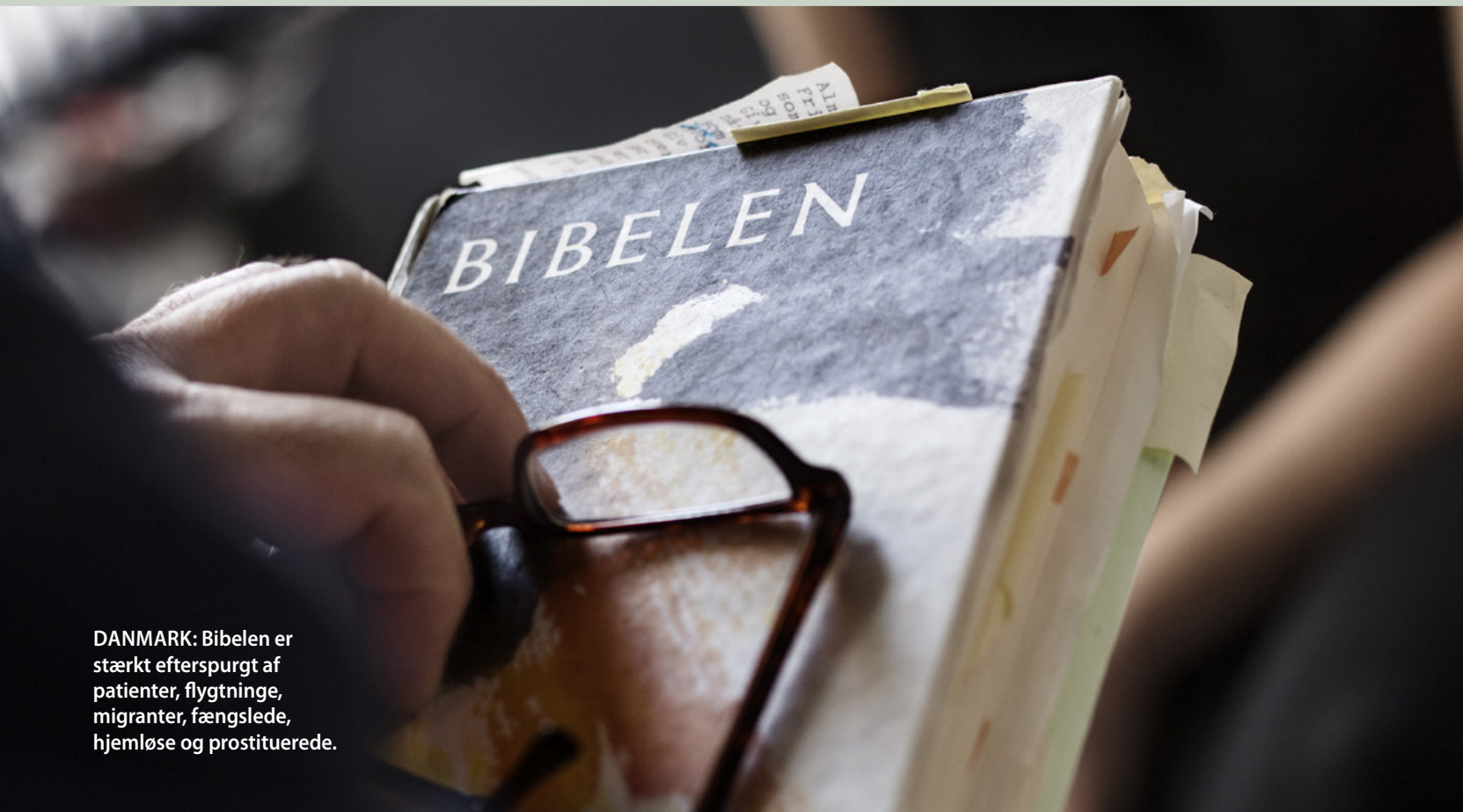
DANMARK: Bibelen er stærkt efterspurgt af patienter, flygtninge, migranter, fængslede, hjemløse og prostituerede.