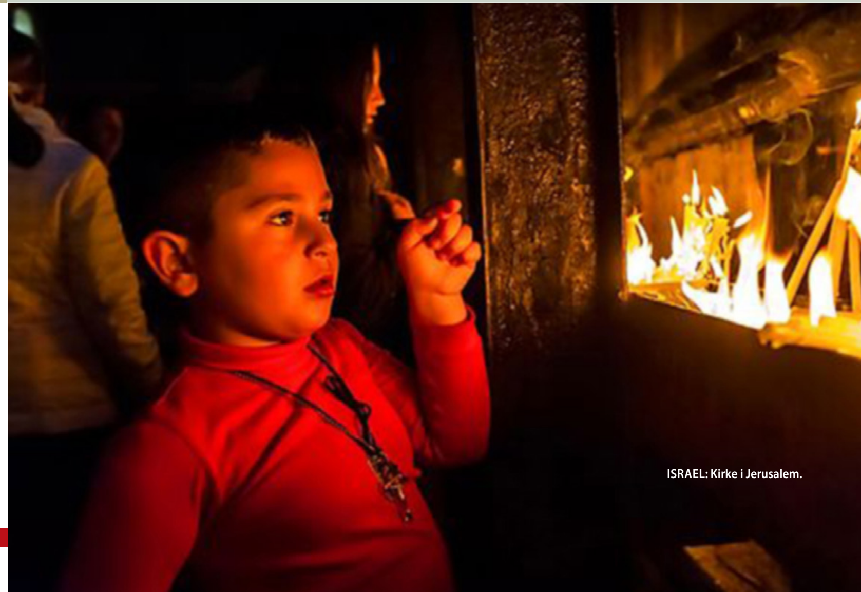
ISRAEL: Kirke i Jerusalem.

Sæt ovnen på 150 grader. Skær frugten i mindre - ca. 1 x 1 cm - store stykker. Kom frugten i en skål, og vend med most eller cider. Lad det stå, imens resten af dejen tilberedes. Rør smør og sukker sammen i en skål. Pisk et æg ad gangen ned i dejen. Kom mel i en anden skål. Flæk vaniljestangen, og skrab kornene ned i melet. Bland krydderier i. Kom melet i dejen, og rør godt rundt. Tilsæt nu frugt plus most eller cider, og rør godt rundt. Vend nødder i, og rør rundt. Smør en springform på 24-26 cm, eller dæk den med bagepapir, og kom dejen heri, og glat ud. Bag kagen midt i ovnen i 2 timer. Sluk for varmen, men lad kagen stå i den lukkede ovn, indtil den er helt kold, gerne natten over. Drys rigeligt med flormelis over kagen.