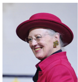
Bibelselskabets protektor er Hennes Majestæt Dronning Margrethe II.