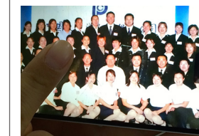
Ren peger på et foto af sig selv i uniform. Det var dengang, hun endnu arbejdede som jurist. I dag går hun altid i løsthengende klæder, som en symbolsk markering af sin nyvundne frihed.