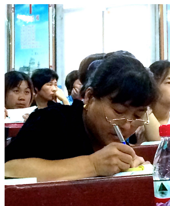
Der noteres flittigt i Bibelen under gudstjenesten. I Kina er de fleste præster kvinder.

”Ind imellem klager de over, at kvinderne bor