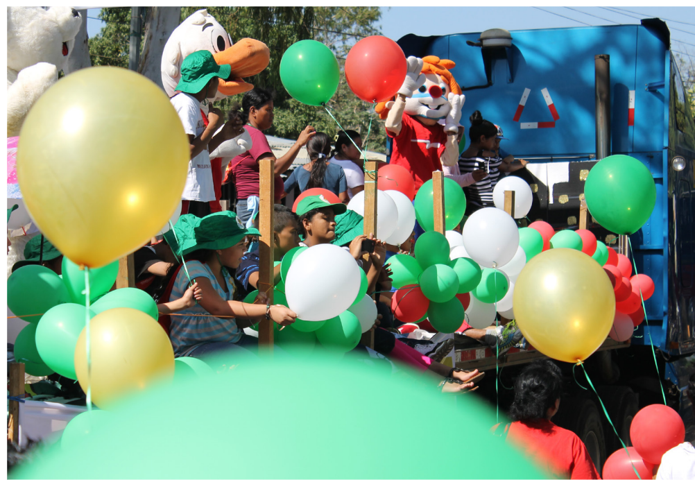
Bibelselskabet arrangerer også underholdning, så børnene kan få de mørke tanker sendt på flugt.