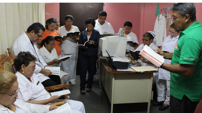
Medarbejdere på La Mascota Hospitalet studerer Bibelen i fællesskab.