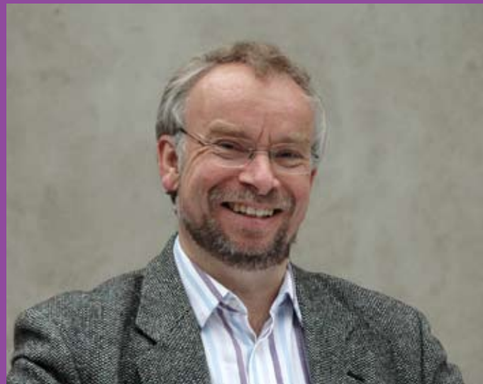
Allerede 10. september deltager den nye biskop og præsident i sit første bestyrelsesmøde i Bibelselskabet.