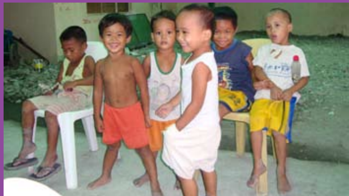
Mødedeltagerne nåede at besøge et par af Det Filippinske Bibelselskabs projekter og hilste blandt andet på disse glade børn i kirken i byen Basseco.

De Forenede Bibelselskaber (UBS), der samler omkring 150 nationale bibelselskaber har det seneste år tydeligt mærket finanskrisen. Således er tilskuddene gået ned fra Det Amerikanske Bibelselskab (ABS), som er klart den største bidragsyder til bibelarbejdet gennem UBS. Amerikanerne skaffer en del af deres midler fra fonde og store enkeltgivere, som har måttet se deres formuer falde i værdi og afkast og derfor har reduceret deres gaver. Det samme billede ses i nogen grad i andre lande. Det var baggrunden for, at UBS og ABS i fællesskab havde inviteret en række bibelselskaber til en fælles rådslagning i Filippinerne i august. Der var deltagere både fra de store indsamlede bibelselskaber og fra de bibelselskaber, som udfører bibelprojekter for pengene. Fra Danmark deltog indsamlingschef Tage Kleinbeck. Hovedemnet for mødet var en nøje prioritering af indsatsen de kommende år, så de vigtigste kerneområder sikres, selv om krisen måtte vare ved. I de allerfattigste lande kan bibelselskaberne simpelthen kun overleve, hvis de modtager støtte udefra. Andre steder – f.eks. i