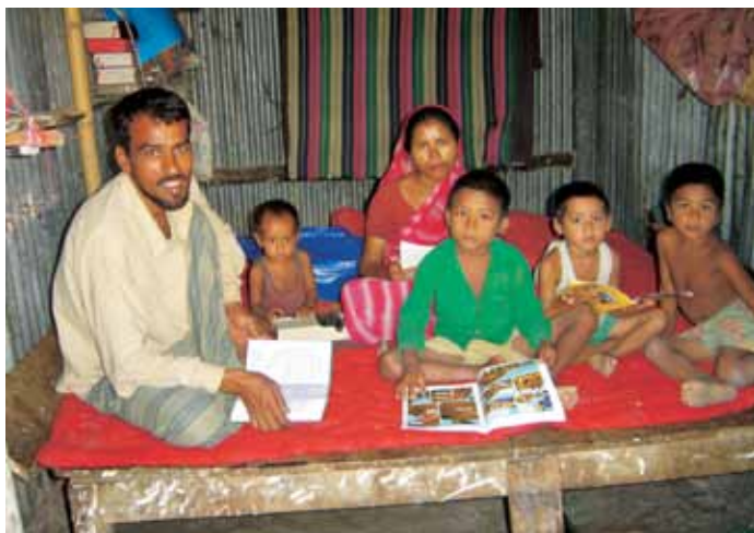
Familiens yngste har fået lov at dreje lydbåndet, mens de øvrige forsøger at læse teksterne

Men bibelarbejdet i Bangladesh er ikke kun mission. Det er også støtte til de kristne i landets mange små og meget spredte kirker. Det er vigtigt, at de både får bibler, gode materialer og moralsk opbakning til at klare sig, selv om de udgør et lille mindretal. Knap 100.000 bibler og bibeldele sælges eller uddeles af kirker, organisationer og evangelister. 10.000 af oplaget er læse-let-udgaver til voksne, som først for nylig har lært at læse, og for hvem den almindelige bibeltekst vil være for svær.