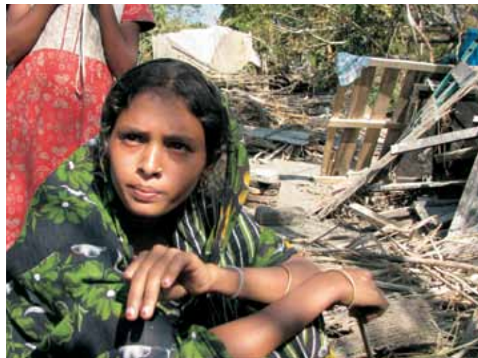
En kvinde har fået sit hus raseret af en af de tilbagevendende tropiske storme

Men mellem nødsituationerne er der en hverdag. Der bor cirka 140 millioner i Bangladesh, omkring 85 % er muslimer og godt 10 % er hinduer. Landets bibelselskab betjener derfor ikke kun de kristne, men ser det også som en særdeles vigtig opgave at give søgende mennesker fra alle religioner mulighed for at møde det befriende budskab om den Gud, der lod sin egen søn blive menneske. Bibelselskabet i Bangladesh oplever i disse år, at "døre åbnes og muligheder opstår". Selskabet arbejder sammen med partnerorganisationer, der har mange unge frivillige medarbejdere. Selv om disse kristne unge tilhører et mindretal, har de alligevel frimodighed til at tage rundt til bus- og togstationer, til færgelæjer, markedspladser og hvor der ellers færdes mange mennesker for at sælge bibles, testamenter el-