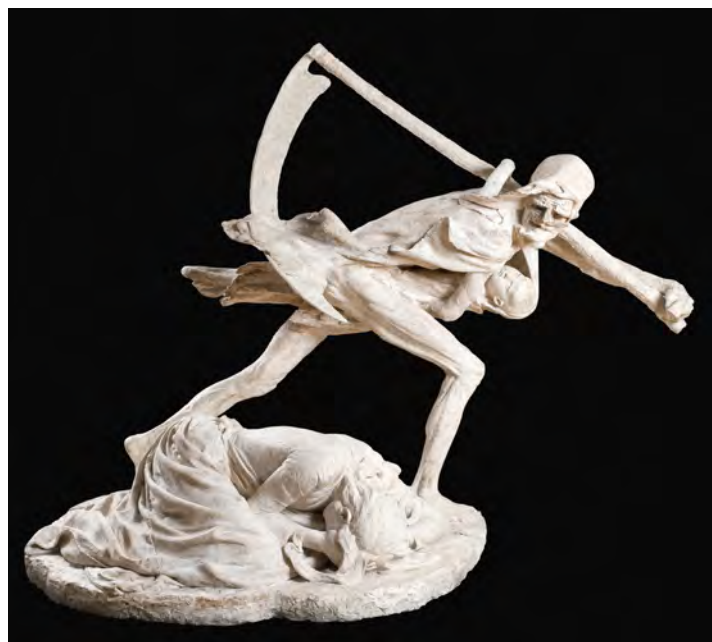
Niels Hansen Jacobsen: Døden og moderen. 1892.