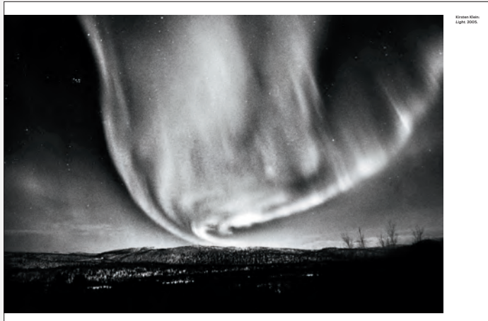
Kirsten Klein: Light. 2005.