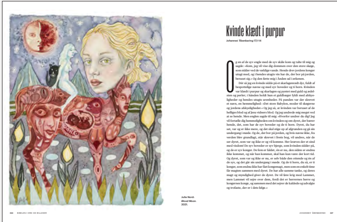
Julie Nord: Blood Moon. 2021. © Julie Nord/VISDA.