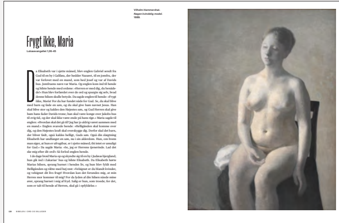
Vilhelm Hammershøi: Nøgen kvindelig model. 1889. SMK, public domain.