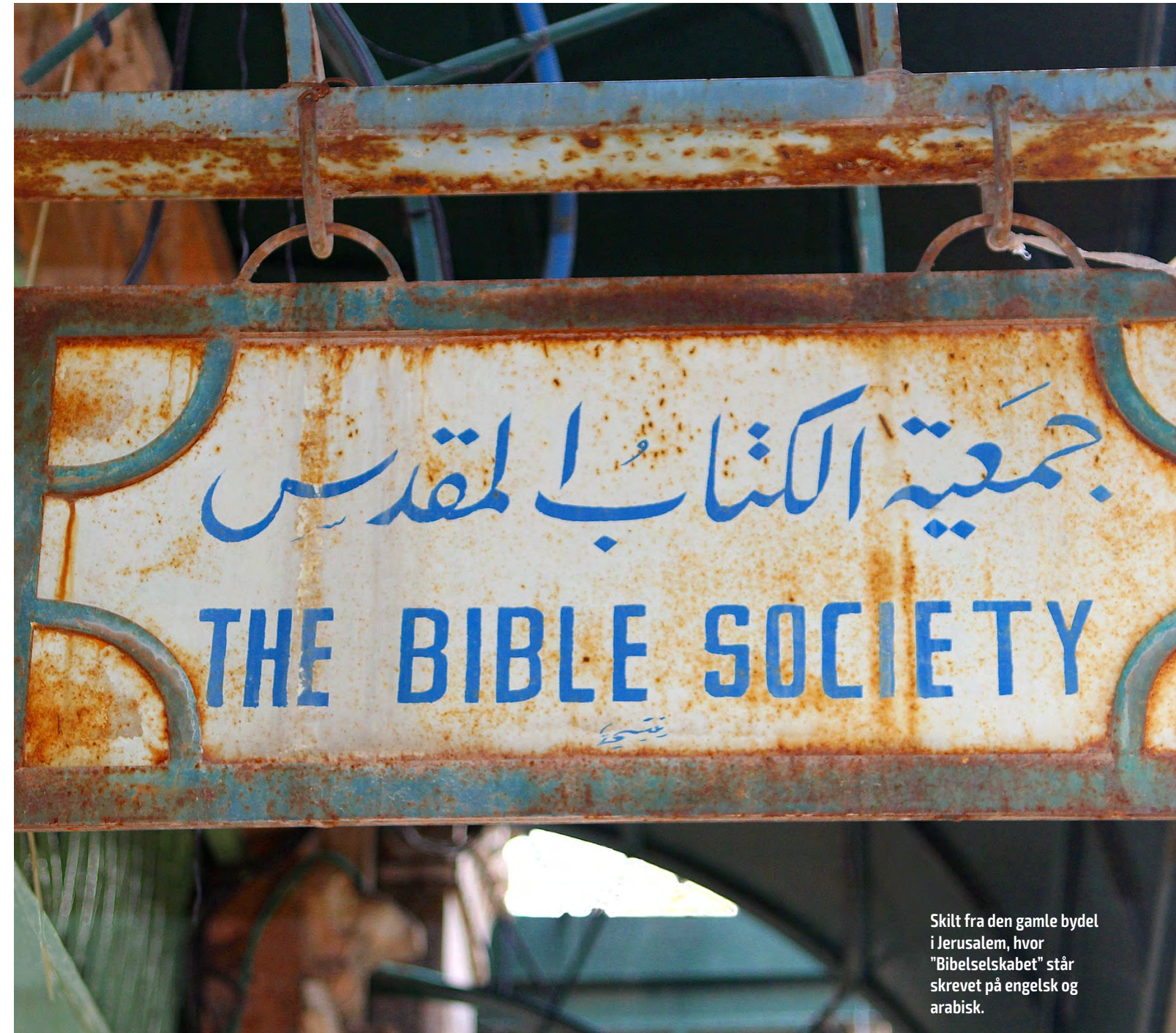
Skilt fra den gamle bydel i Jerusalem, hvor "Bibelselskabet" står skrevet på engelsk og arabisk.

De tre bibelselskaber nævner alle bøn som uundværligt. Vær med til at bede for de tre bibelselskaber og for håb og fred!